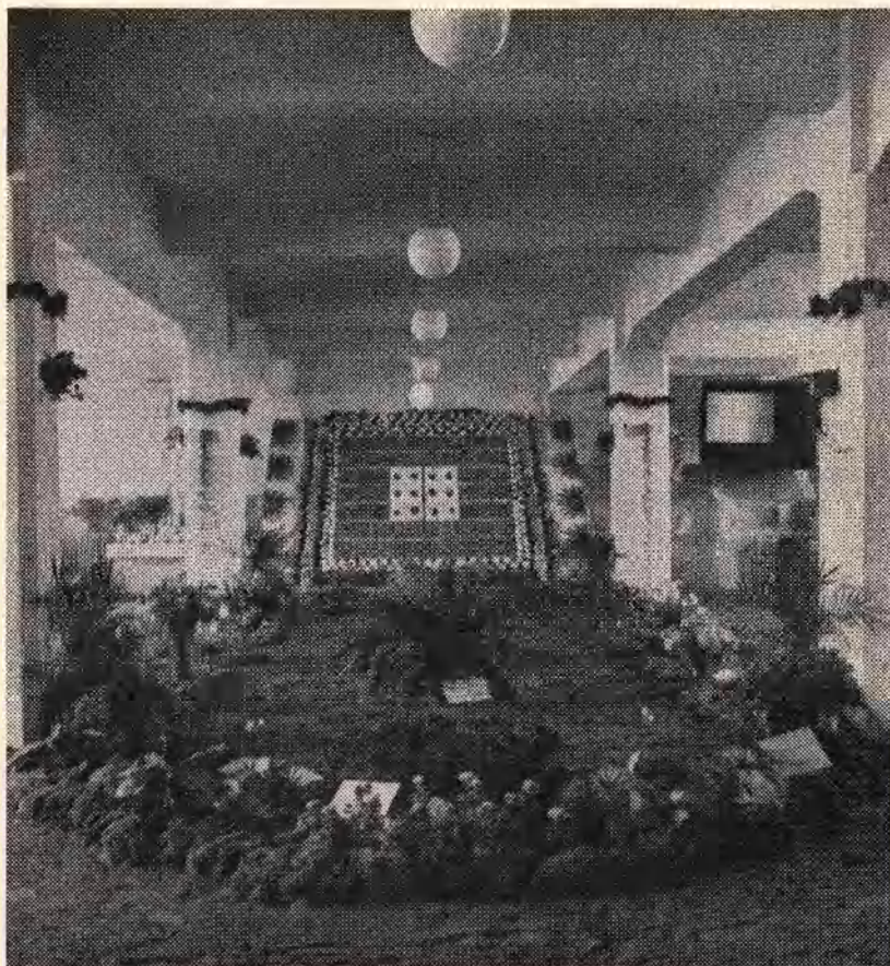
Garðyrkjusýningin 1938 (Í vöruhúsi Grænmetisverzlunar ríkisins).

hugsandi maður láta hjá líða að sjá“, enda varð aðsóknin eftir því.